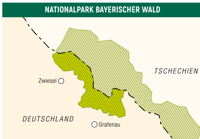
■ Nationalpark Bayerischer Wald ■ Nationalpark Šumava

Am 7. Oktober 1970 wurde der Nationalpark Bayerischer Wald mit einem Staatsakt in Neuschönau gegründet. Der damalige Landwirtschaftsminister Hans Eisenmann dankte Weinzierl und Grzimek und bezeichnete sie als „mächtige Vertreter des Nationalparkgedankens“. Doch wie richtig Grzimeks Mahnung gewesen war, der Nationalpark solle internationale Standards erfüllen, zeigte sich bald.